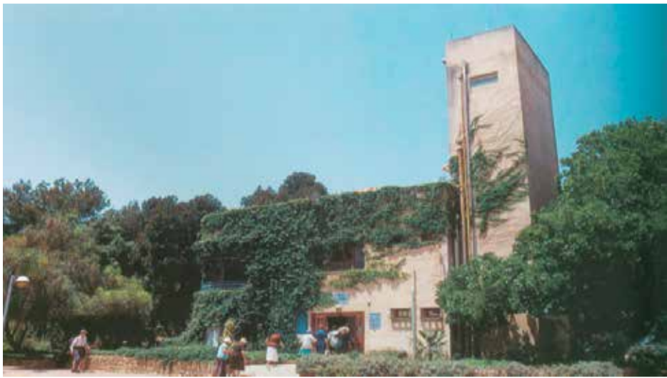
חוסמסה (חולון) - בסיס האימונים של ההגנה בגוש דן