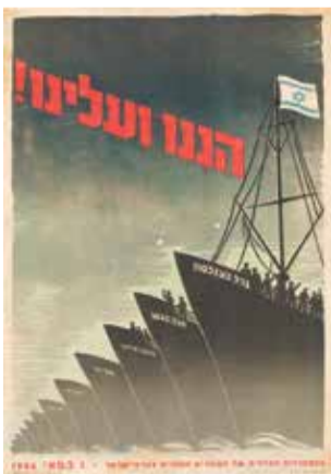
כרזה על מפעל ההעפלה

במהלך מלחמת העולם השנייה נאבק היישוב בטרור הערבי ובצד זאת הושיט כתף לצבא הבריטי במלחמתו בנאצים. יותר מ-30,000 אלף יהודים, כולל 4,000 נשים, התנדבו לצבא הבריטי גם כדי לרכוש ניסיון צבאי לקראת הקמת מדינה יהודית, בלי שידעו איך ומתי תוקם. מפרוץ מלחמת העצמאות, ב-30 בנובמבר 1947, ועד הקמת צה"ל עם ההכרזה על הקמת המדינה ב-14 במאי 1948, היו אלה כוחות ההגנה שלחמו במערכה על הבקעת המצור על ירושלים, במקביל להגנה על הגליל והנגב. עשרות אלפי חיילים בוגרי ההגנה הצטרפו במלחמת העצמאות לכוח הלוחם של צה"ל. ארגון ההגנה הקים את השיירות (השם שניתן או לתחומי הפעילות) שהפכו לחילות האוויר, הים, השריון, המודיעין, הקשר, ההנדסה ועוד.