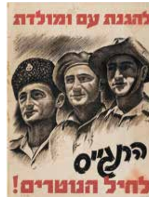
כרזת עידוד לגיוס לנטורים (משטרת היישובים העבריים) | צילום: באדיבות ארגון מורשת ההגנה

הייעוד של ההגנה לא היה ביטחוני בלבד. הארגון הוביל עוד שתי משימות מרכזיות: להרחיב את גבולות ההתיישבות הציונית ולפעול בנחישות לעליית יהודים, גם בדרכים לא לגליות בתגובה לגזירות "הספר הלבן" של הבריטים. מפעל ההתיישבות הכולל היה בשלוש השנים 1936-1939 בשיטת "חומה ומגדל". ראשון היישובים היה תל עמל, היום קיבוץ ניר דוד, שעל גדות נחל האסי בעמק בית שאן, והאחרון - כפר ורבורג בדרום. בשנות ה-40 של המאה הקודמת יום ארגון ההגנה מבצעי התיישבות ביטחוני-אסטרטגית, בעיקר באזורים מרוחקים ומנותקים כמו הנגב והגליל. ב-1943 הוקמו שלושה מצפים בנגב וחמש היאחזויות של הפלמ"ח בגליל לחיזוק האחיזה היהודית. שיא נוסף בקביעת עובדות בשטח, לקראת גיבוש מפת המדינה היהודית בדיוני האר"ם, היה הקמת 11 יישובים בדרום ובנגב במוצאי יום כיפור תש"ז (אוקטובר 1946). היה זה מבצע משור לב של ההגנה, ההסתדרות הכללית, המוסדות הלאומיים והמתיישבים. בשנות השלטון הבריטי (1920-1948) הוקמו בארץ ישראל 250 (!) יישובי