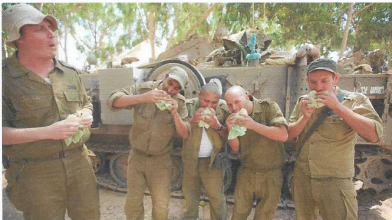
"השבטים עוברים סוציאליזציה בצה"ל"

"ברגע שמדברים על צה"ל כצבא מקצועי זה צבא גדול מדי בשביל המדינה הזאת ובשביל היכולת הטכנולוגית-מדעית שפיתחנו. התפקיד הזה (כמחולל סוציאליזציה, ש.ג.) הוא הכי חשוב, מעבר לתפקיד הכוח שמילאה ההגנה בתקופת המדינה. זה תפקיד שאין לזלזל בו, בעיקר על רקע השסעים של זמננו".