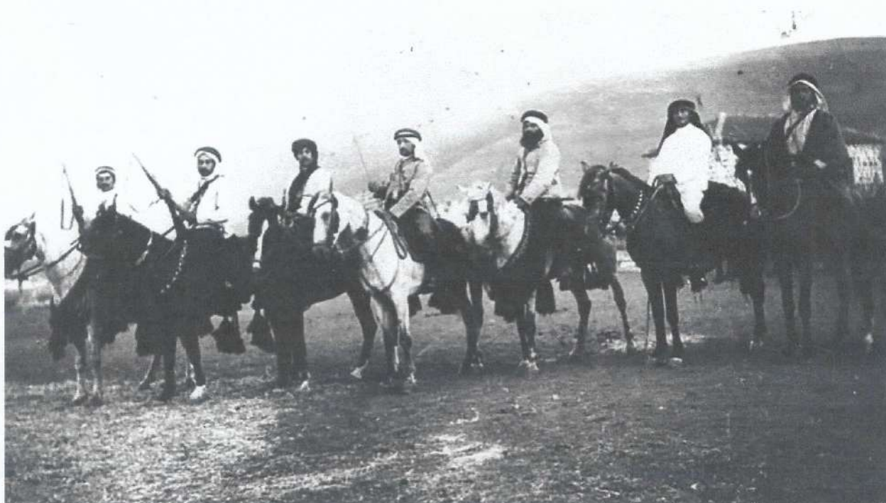
חברי "השומר" בכפר גלעדי. ארגון מחתרתי, חשאי, סגור ולכן גם מוגבל וקטן"

"הבעיה של ארגון השומר", אומר עילם, "הייתה שהוא היה ארגון מחתרתי, חשאי, סגור ולכן גם מוגבל וקטן. המוקש העיקרי היה ש'השומר' נשמע רק למפקדה שלו ולא לשום גורם חיצוני, גם לא למפלגת האם, 'פועלי ציון', שיסדה אותו. הוא נכשל בניסיון לנהל את מדיניות הביטחון והשמירה במושבות הראשונות, לפני מלחמת העולם הראשונה, כי המושבות לא היו מוכנות לקבל את תכתבי השומר ואת סדרי השמירה שלו והם סלקו אותו.