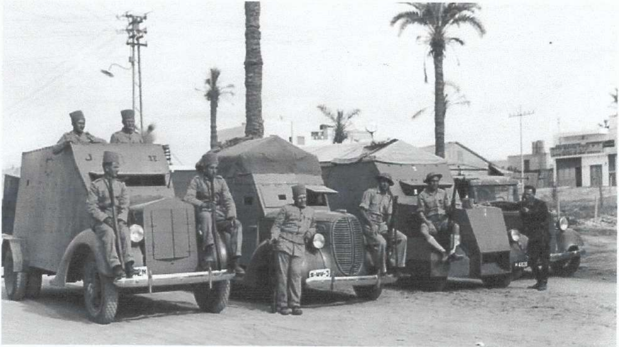
משוריינים ההגנה. "מאיפה הגיעו כל כלי הרכב?"

לראות את ההגנה כחלק מ"איטאל" שהתגשם באמצעות ההסתדרות. לדבריו, הדרך הנכונה להבין את סוד הצלחתו של הארגון היא דרך עקרון הכלליות. "אני מסתכל על תופעת השיירות לדוגמה", אומר קדיש, "מה זה הדבר הזה? בשיירת הראל היו למעלה מ-200 כלי רכב. מאיפה הגיעו כל כלי הרכב? מאיפה באו 400 נהגים, בכל רכב היה נהג ונהג משנה, והמשקן המשיך לתפקד ולא הפסיקו אותו בשביל הפעולה הזו. מאיפה הדבר הזה? התשובה היא במידה רבה מההסתדרות ומגלגולים של ההסתדרות וההתיישבות העובדת.