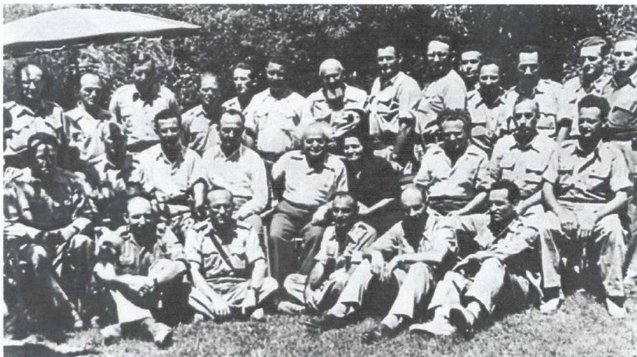
דוד בן גוריון עם הפיקוד הבכיר של ההגנה

מייצג את הרצון הכללי, אני יודע מה נכון וחשוב לעשות לבטחון הישוב".