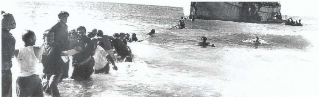
אנשי ההגנה (פלי"ם) מורידים מעפילים מספינת המעפילים 'האומות המאוחדות' בחוף נהריה, 1 בינואר 1948

לדברי ד"ר מרדכי נאור, פעולות ההתיישבות והבאת העולים של ההגנה, החורגות מתחומי הביטחון, הן היבט נוסף לעיקרון הכלליות. "תנועה לאומית שיש לה ארגון חמוש", מסביר נאור, "בדרך כלל עוסקת בדבר אחד – באימונים צבאיים, ובלנסות לסלק את מי ששולט בטריטוריה. כאן היו שתי פעולות שלא היו כדוגמתן בעולם. אחת היא ההתיישבות. ב-1920 היו בארץ 50 ישובים יהודים וב-1948 היו 300. הפער הזה של 250 ישובים הוא במידה רבה מה שקוראים 'ישובים ביטחוניים', כמו חומה ומגדל. מי שהקים אותם זו ההגנה.