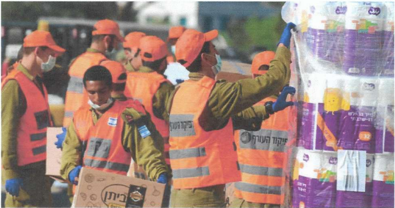
צנחנים בבני ברק במהלך מגפת הקורונה. "בלי צבא העם יהיה לנו קשה מאוד בעמידה באתגרים ביטחוניים"

"אחד השרידים האחרונים לתפיסה הזו אלה דבריו של בוגי יעלון, שאומר שבכל פעם שהוא היה חותם מחדש לצבא, הכתובת שלו הייתה גרופית. הוא יעד את עצמו לחזור לשם, אבל בינתיים צריך אותו, אז בינתיים הוא חותם. זה נשאר מגלגולי הרעיון של צבא העם".