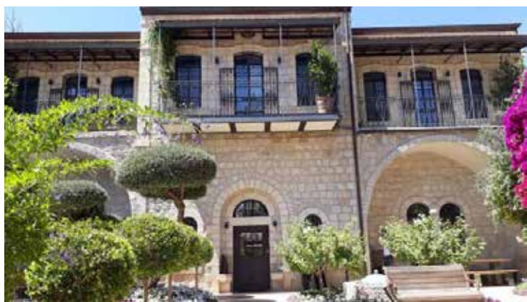
בית ועד העיר (רח' אתיופיה 15)

רוב השיחות התקיימו בערבית, למעט שיחות בודדות שהיו בטורקית ותוכנן לא נרשם מחוסר שליטה בשפה. זיהוי המנויים נעשה באמצעות מדריך הטלפון. התכנים נרשמו בעברית או בערבית, והערות צוינו לעיתים בשם "המערכת". קיימים רישומים כפולים אך לא זהים של אותן שיחות בכתב יד זהה. חלק מרישום השיחות המפורט הודפס בעברית וחלק תורגם לאנגלית ונשלח ללונדון לצורך המאבק המדיני שהתנהל אחרי המאורעות. השיחות עסקו במגוון של נושאים וסיפקו תמונה פוליטית וחברתית רחבה ובכללה: תיאום מועדי השביתה והפגנות מחאה לקראת יום הצהרת בלפור ואירועים אחרים; פעילות ועדות החרם לרכש מיהודים; תוצאות פגישה של המופתי והנהגה הערבית עם הנציב העליון; היערכות לקראת