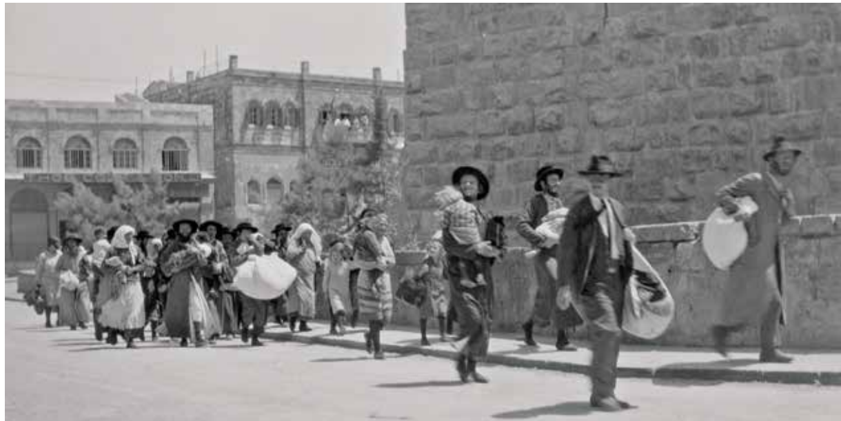
יהודים נושמים את העיר העתיקה במהלך מאורעות תרפ"ט

מנהיגי היישוב שהו באותם ימים בקונגרס הציוני ה־16 בציריך, שבו הוחלט על הקמת הסוכנות היהודית. היחיד שהספיק לחזור