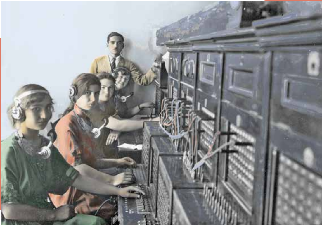
סלמנות במרכזיה בירושלים בתקופת המנדט

והיו האירוע המכונן שהביא את יצחק בן-צבי, אז ראש הוועד הלאומי ולימים נשיא המדינה, ליזום את ראשית השימוש במודיעין התקשורת ביישוב ולבססו במסגרת "הלשכה המאוחדת" – גוף המודיעין שהוקם בסוף שנת 1929.