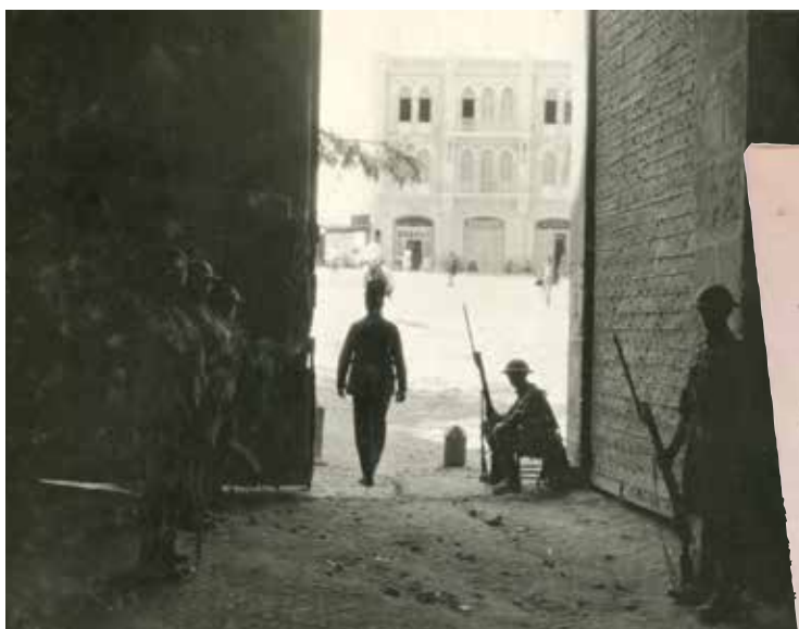
חיילים בריטים שומרים בכניסה לשער שכם בזמן המאורעות, ברקע בית המועצה המוסלמית העליונה

יצחק בן-צבי ורחל ינאית שהו בבית הוועד והיו גורם מקשר בין מפקדת ההגנה, הציבור, השלטונות וח"ל. על אף סגר הטלפונים הכללי, בן-צבי הצליח לדווח לארצישראלים בקהיר על הפרעות ועל הנעשה בארץ באמצעות "פירצה" – קו טלפון