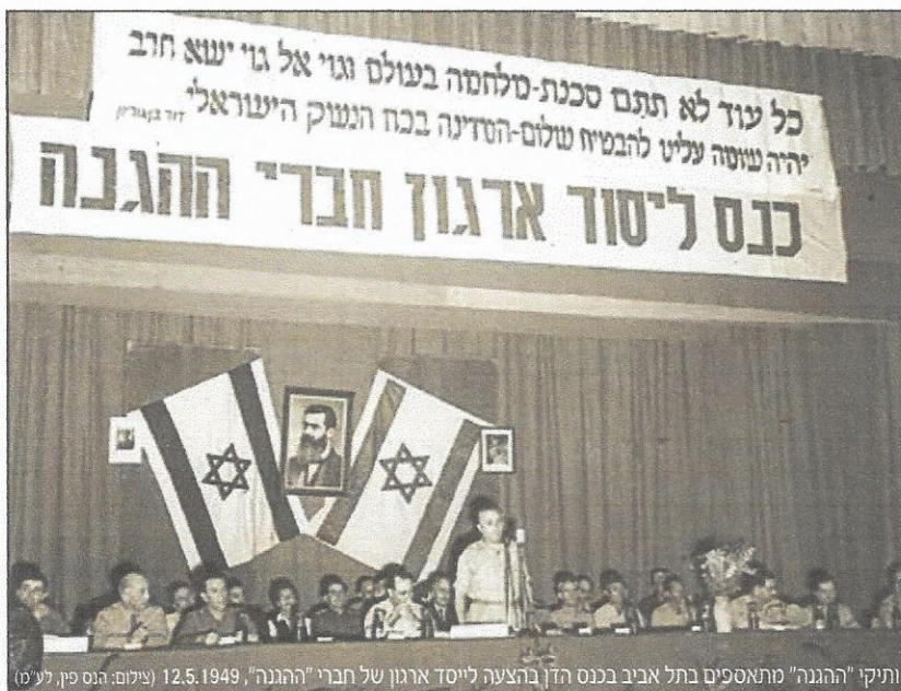
ותיקי "ההגנה" מתאספים בתל אביב בכנס ה'ן בהצעה לייסד ארגון של חברי "ההגנה", 12.5.1949.

ההיסטוריה מלמדת כי לפני 100 שנה, וליתר דיוק ביוני 1920, בכנס אחדות העבודה בחוות כנרת, הוחלט על העברת סמכויות ארגון "השומר" לידי מפלגת אחדות העבודה ועל הקמת כוח מגן הנתון לפיקוחה - "ההגנה". בין האישים שהובילו את הרעיון והפכו לדמויות מפתח בארגון החדש היו אליהו גולומב, חבר ועדת היסוד של "ההגנה" והוועד הלאומי ולמעשה מפקד ההגנה זאב ז'בוטינסקי, אשר ייסד ופיקד על כוחות ההגנה בירושלים